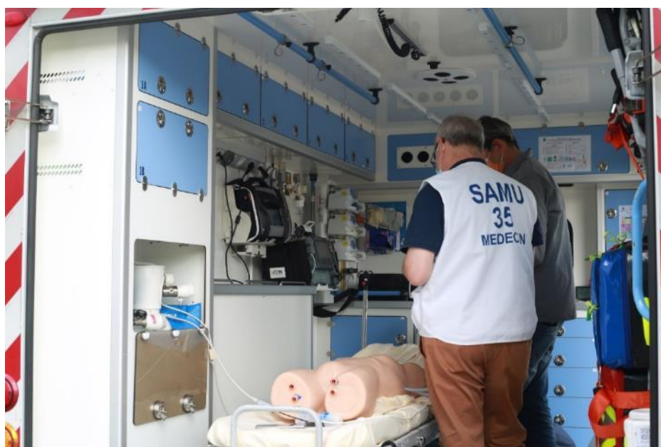
Télé expertise dans une ambulance connectée @b<>com