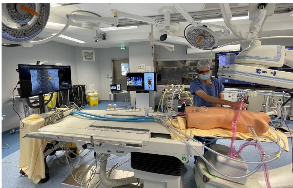
Expérimentation 5G en salle TherA-Image au CHU de Rennes : simulation d'intervention cardiaque sur un patient « fantôme » suivi par un chirurgien à distance @b<>com

La technologie 5G ouvre des perspectives formidables dans le domaine de la santé. Une expérimentation inédite a été réalisée ce jour au CHU de Rennes en partenariat avec AMA, b<>com, Nokia, Orange, et Philips : la simulation d'une intervention chirurgicale en salle d'opération sans fil. Elle fait suite à un premier test mené en septembre 2021 de diagnostic à distance lors d'une intervention médicale d'urgence dans une ambulance connectée. Rendus possible grâce à des fonctionnalités avancées de ce réseau de nouvelle génération, ces essais s'inscrivent dans le cadre du projet de recherche européen 5G-TOURS 1 associé au programme européen Horizon 2020. Retour sur ces avancées prometteuses au service de la qualité et de l'efficacité de la prise en charge des patients.